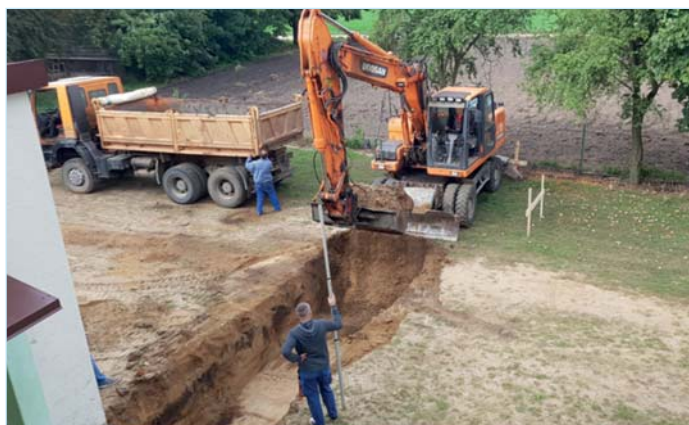
W Krajkowie ruszyła rozbudowa szkoły