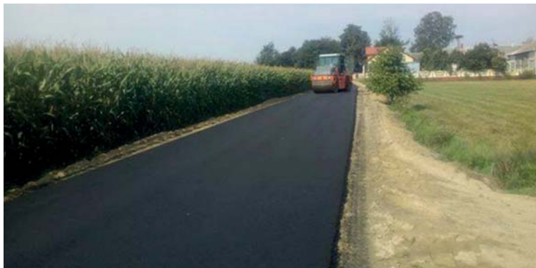
Nowa droga w Młodochowie

I tak w Koziębrodach do zrobienia jest zaledwie 300-metrowy odcinek, ale trzeba odwodnić teren. Na niezbędną w tej sprawie decyzję Wód Polskich gmina Raciąż czeka od marca. O trzy miesiące wydłużyła się procedura związana z budową drogi do Sobocina (1450 m). Tyle trwało oczekiwanie gminy na „ruch” ze strony Wód Polskich. Dopiero zażalenie złożone na opieszałość tej instytucji pozwoliło zrobić kolejny krok,