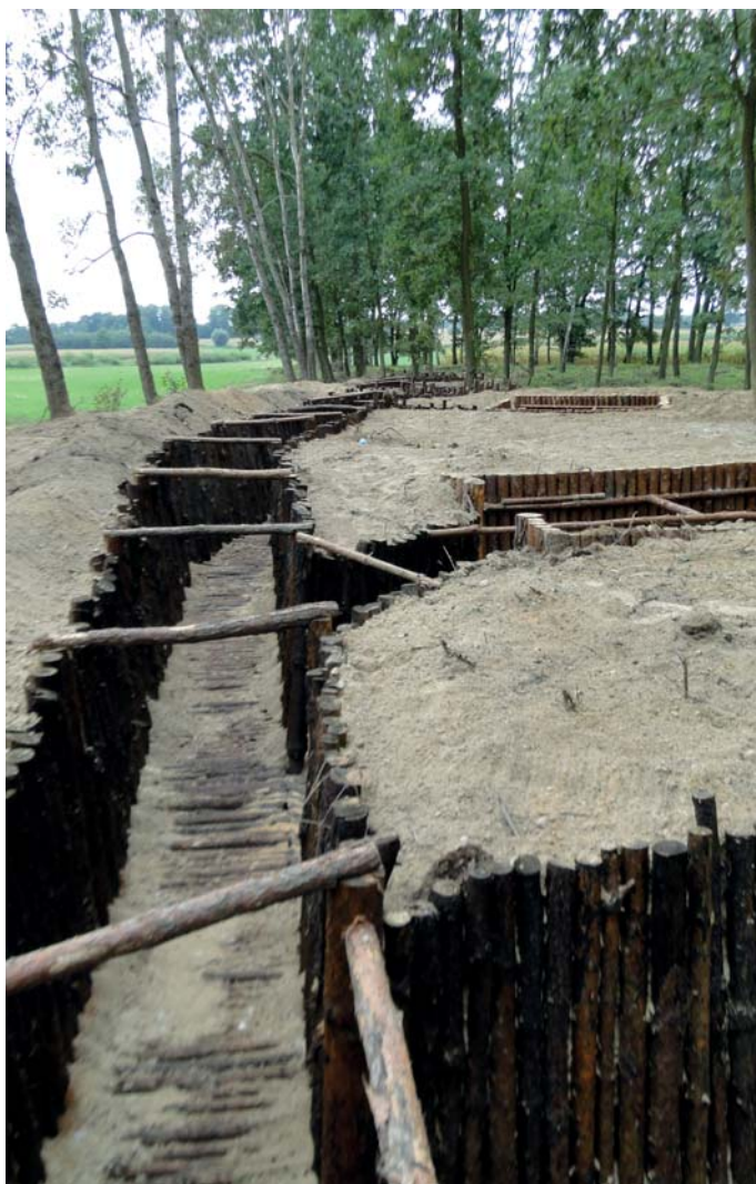
Zrekonstruowane okopy z I wojny światowej w lesie w pobliżu Strożęcina