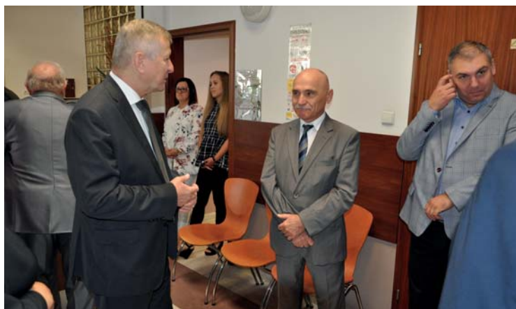
W otwarciu placówki uczestniczyli przedstawiciele władz samorządowych gminy, miasta i powiatu oraz płońskiego szpitala