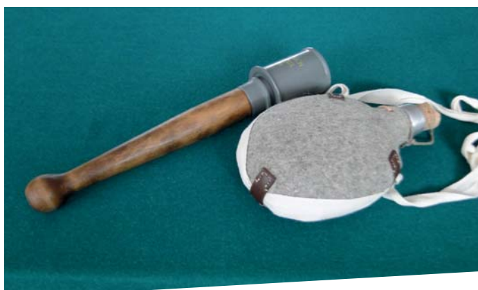
Gmina Raciąż zakupiła umundurowanie, uzbrojenie i elementy wyposażenia żołnierzy obu stron konfliktu – wojsk pruskich i carskich