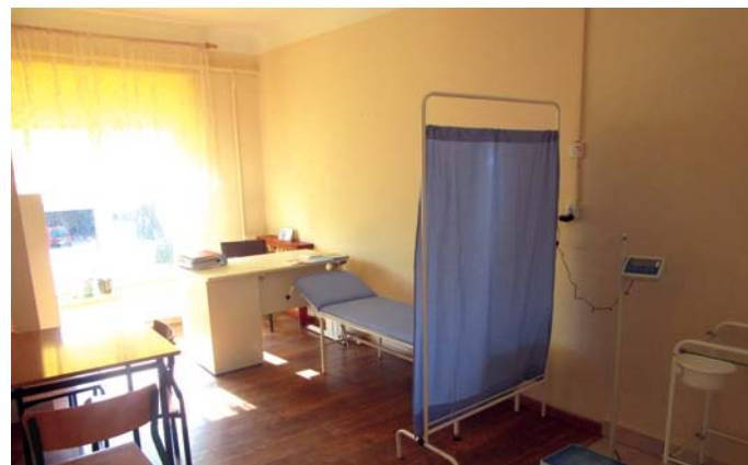
Gabinet profilaktyki zdrowotnej w Koziebrodach